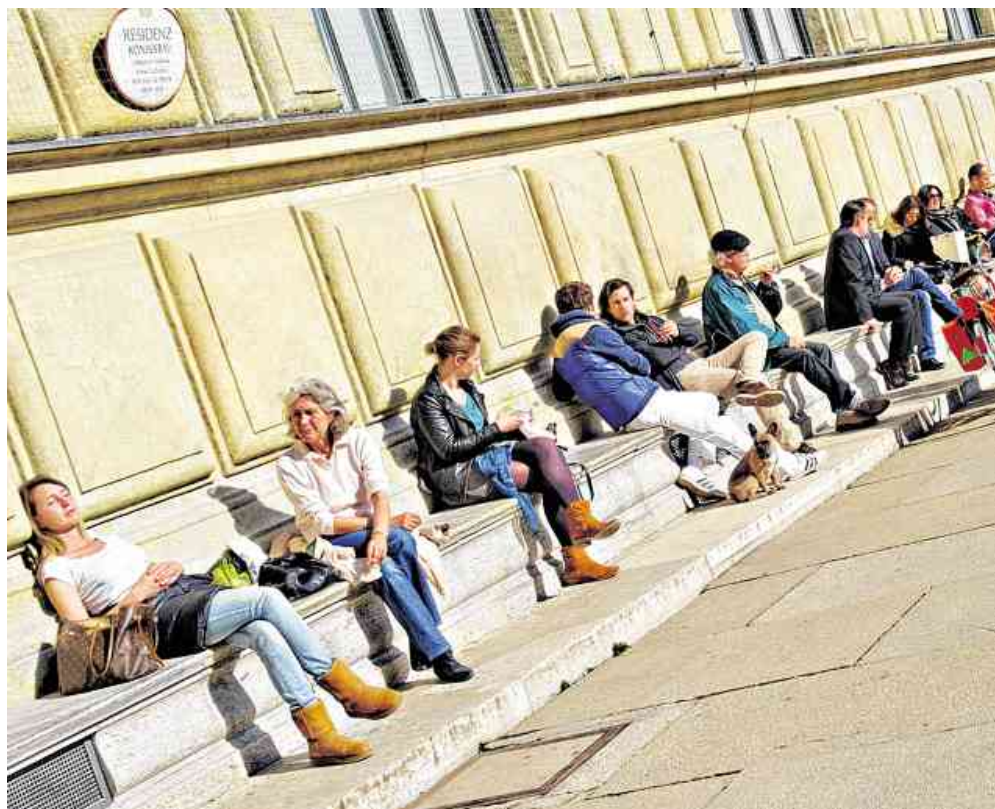
Es geht uns schon ziemlich gut in Bayern (und nicht nur bei Sonnenschein am Max-Joseph-Platz). Nur Baden-Württemberger sind noch gesünder als Bayern.

Da akute Infektionen in der Regel sehr schnell verheilen, fallen sie für den Arbeitgeber jedoch weniger schwer ins Gewicht als etwa Rückenschmerzen. Hier hängen die 40- bis 65-Jährigen die anderen Altersgruppen mit 90 krankgeschriebenen Arbeitstagen je